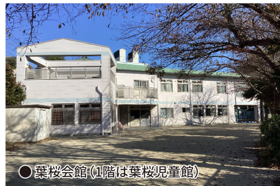
●葉桜会館(1階は葉桜児童館)

公共施設の維持整備の負担が重くのし掛かるこれからの時代、町が整備してくれるのを待つだけでなく、空家の利用なども含めて町と知恵を出し合うことも必要だと思っています。