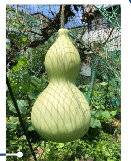
我が家の庭のひょうたん、結構大きくなりました。