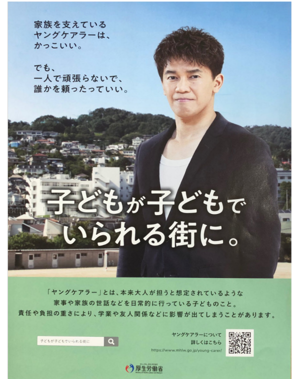
● 厚生労働省作成のポスター